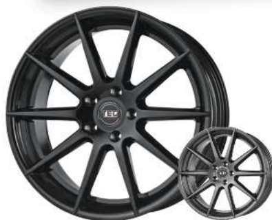
TEC „GT7“ schwarz matt lackiert, 19"–20"

Auch in anthrazit matt lieferbar! 19" nur 200,-