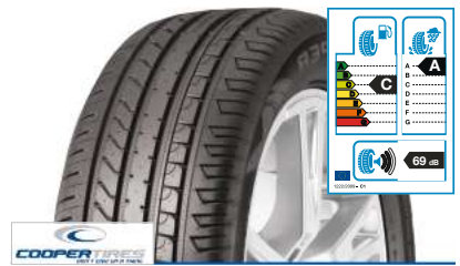
COOPER Zeon 4XS Sport 235/50 R 18 97V BSW