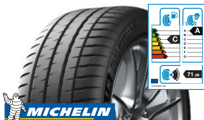
MICHELIN Pilot Sport 4 245/40 ZR 18 (97Y) XL