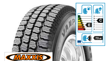
MAXXIS MA-LAS 215/65 R 16 C 109/107T