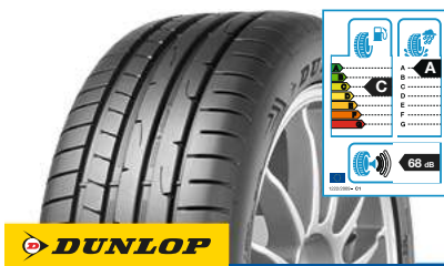
DUNLOP SP Sport Maxx RT 2 225/40 ZR 18 (92Y) XL MFS