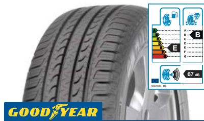
GOODYEAR EfficientGrip SUV M+S 235/65 R 17 108V XL FP