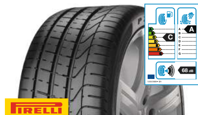
PIRELLI P Zero 245/45 ZR 18 (100Y) XL PZ4