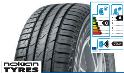
NOKIAN TYRES Line SUV 235/60 R 17 102V