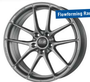
O.Z. „Leggera HLT“ anthrazit lackiert, 17"–20"

Auch in anthrazit matt lieferbar! 19" nur 200,-