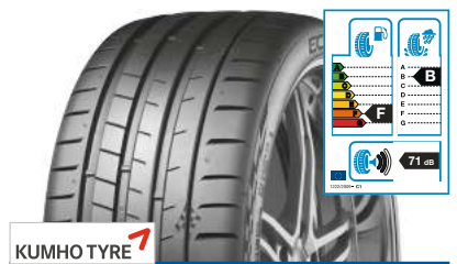
KUMHO TYRE Ecsta PS91 235/35 R 19 91Y XL