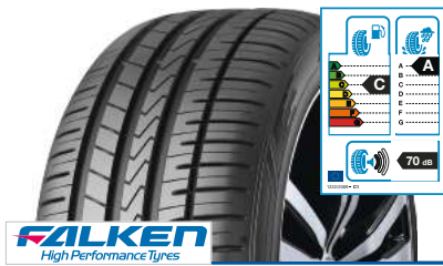
FALKEN High Performance Tyres Azenis FK510 SUV 255/55 R 18 109W XL