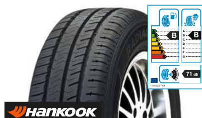
HANKOOK Radial RA28E 205/65 R 16 C 107/105T 8PR