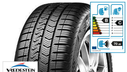
VREDESTEIN Quatrac 5 M+S 235/55 R 17 103V XL