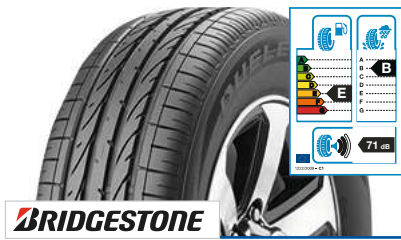
BRIDGESTONE Dueler H/P Sport 215/65 R 16 98H