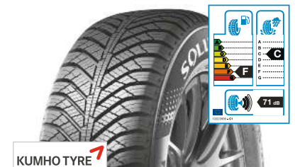
KUMHO TYRE HA31 175/65 R 14 82T