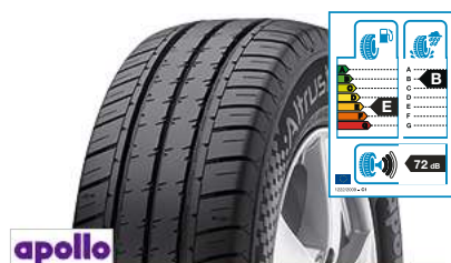
apollo Altrust Summer 195/70 R 15 104/102R