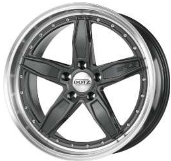
Dotz „SP5“ anthrazit matt/Horn poliert, 18"–20"

Auch in schwarz poliert lieferbar! 18" nur 165,-