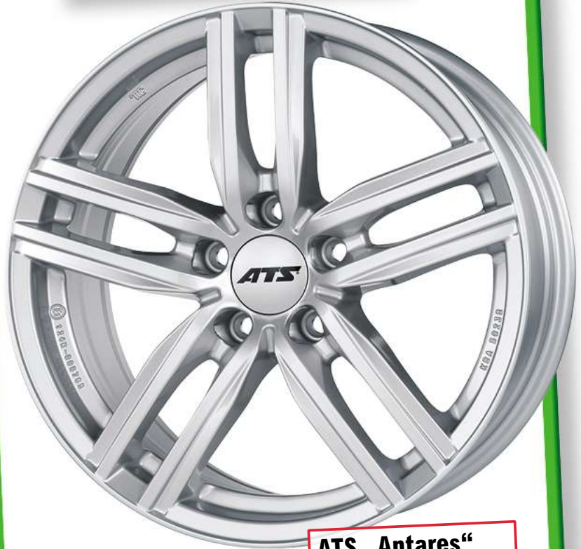
ATS „Antares“ silber lackiert, 15"–18"