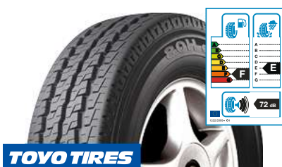
TOYO TIRES H 08 215/65 R 16 C 106T