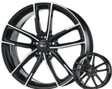
Brock „B38“ schwarz/Front poliert, 18"–20"

Auch in silber lackiert lieferbar! 18" nur 185,-