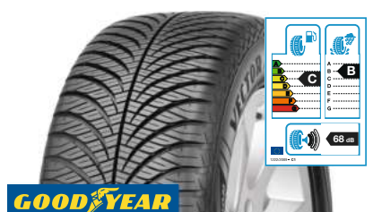
GOODYEAR Vector 4Seasons G2 M+S 205/60 R 16 92H