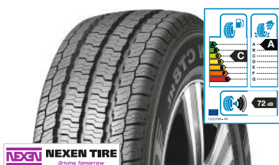
NEXEN TIRE Roadian CT8 235/65 R 16 C 115/113R 8PR