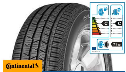
Continental CrossContact LX Sport M+S 235/55 R 17 99V FR