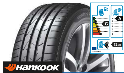
HANKOOK Ventus Prime3 K125 225/50 R 17 98W XL UHP