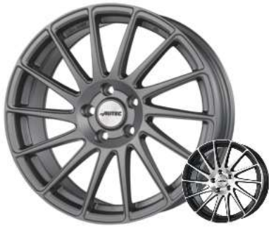
Autec „Oktano“ anthrazit matt lackiert, 18"–19"

Auch in schwarz poliert lieferbar! 18" nur 165,-