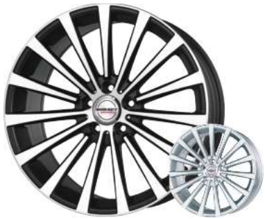
Borbet „BLX“ schwarz matt/Front poliert, 18"–20"

Auch in silber lackiert lieferbar! 18" nur 185,-